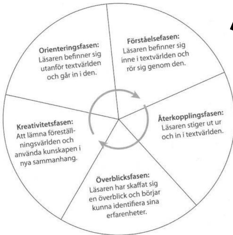
Läsandets-cirkel/faser i läsprocessen (figur av J.A Langer. Översatt av Mary Ingemansson och Petra Magnusson)